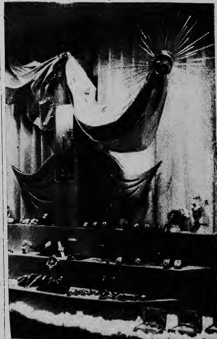
Na Aruba tambe hopi negoshinan ta modernizando nan vitrina continuamente. E foto aki ta muestra e vitrina di Spritzer & Fuhrmann na Oranjestad, cu recientemente a gana e concurso di e show-case mas bonita dorna na Oranjestad.

gun flor di primavera. Esey tabata tur cos tambe, cu excepcion di e baratillonan dos bez pa anja ora cu borchinan grandi cu palabranan „baratillo“ ta danja e poco elegancia di e vitrina por completo. Laga nan mira tur cos cu bo tin den stock, tabata e aspiracion di e tempo ey. Majoria di e comerciantenan den ferreteria y reynon den textil te ainda ta pensa asina y ta keda tene na e tradicion bieu. Tambe pa panaderonan, hotelerianan, comerciantenan den produccion lacteo y henderdoran di sigla ta dificil pa bini